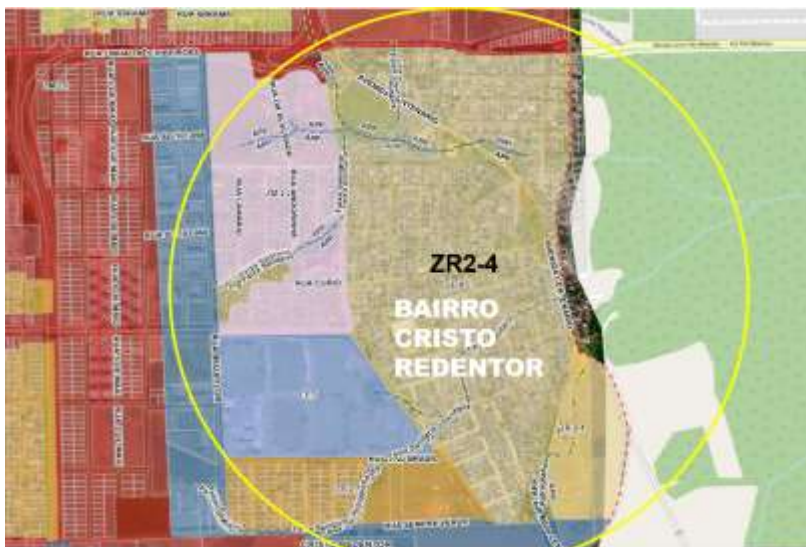
Bairro Cristo Redentor