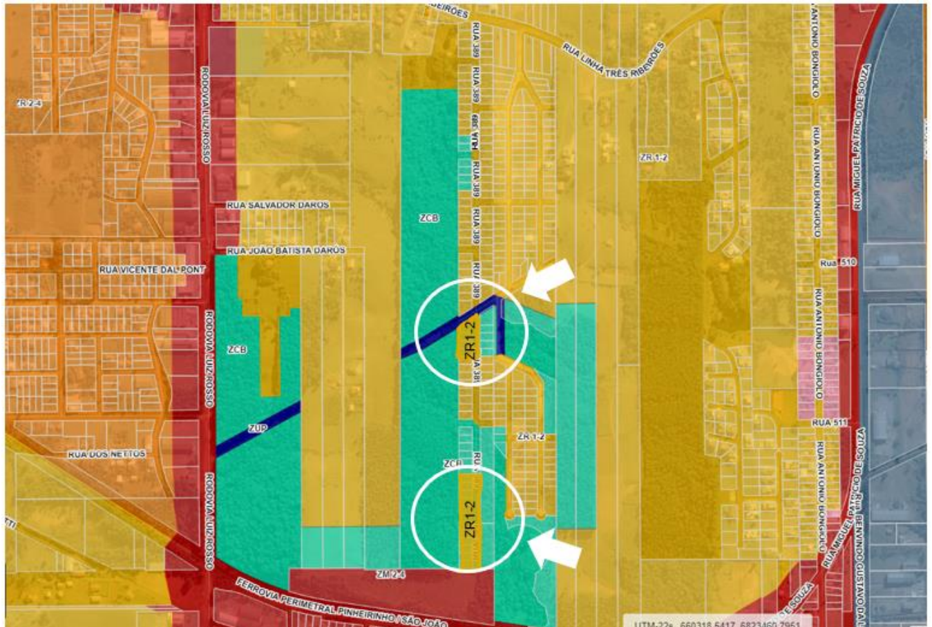
Mapa de correção do zoneamento do solo urbano

ANEXO DA RESOLUÇÃO Nº 393, DE 17 DE JUNHO DE 2021