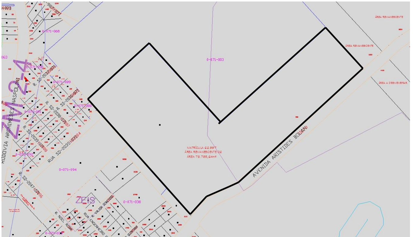
Área para utilização do Art. 169